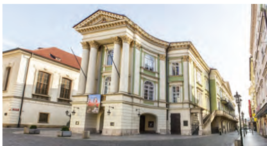
FOTO-KVÍZ okolo STAVOVSKÉHO DIVADLA

Vydejte se na dobrodružné pátrání po detailech, které jsou součástí Stavovského divadla.