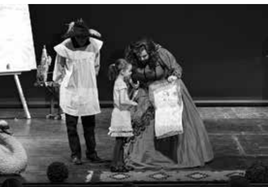
Opera nás baví

Po vybraných představeních nabízíme unikátní možnost setkat se přímo s umělci! Nechte si podepsat či se vyfoťte s Jeníčkem a Mařenkou nebo se samotnou Rusalkou!