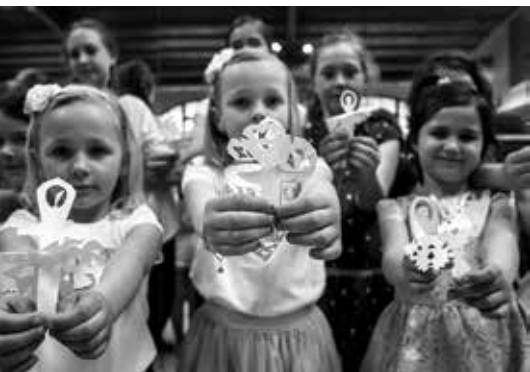
Sněhová královna z papíru

Připravte se na zhlédnutí baletu Marná opatrnost, jehož historie spadá až do roku 1789. Patří sláma k baletu? Jak se tančí v dřevácích? Umí tančit slepice? Živé zvíře na jevišti? Humor k baletu patří stejně jako virtuózní variace – Marná opatrnost z různých úhlů pohledu a na vlastní kůži.