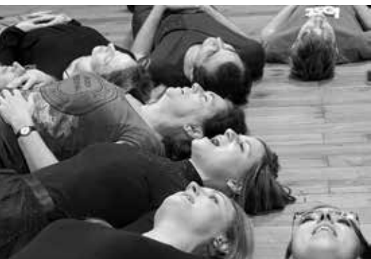
Zpívejme a capella!

O divadle lze psát, mluvit a hlavně – společně ho zažít. Ve dvou setkáních a jedné společné návštěvě představení se budeme zabývat (vašimi) různými pohledy na divadlo i tím, co všechno lze hodnotit a jak napsat recenzi. Pod vedením divadelní lektorky a dramaturgů Činohry ND se podíváme společněma očima na vybraný titul z aktuálního repertoáru. Pro diváky ve věku 15–99let.