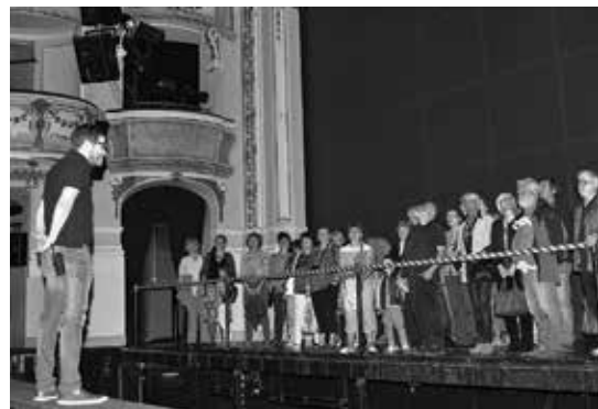
Klub přátel Opery na prohlídce divadla

Více informací naleznete na stránkách Opery Národního divadla v sekci Klub přátel Opery.