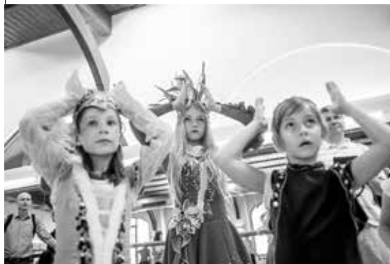
Znáte baletní řeč? Toto gesto sděluje: Jsem královna ...

Dílka věnovaná baletu z hlediska kostýmu, jeho historie a vývoje. Budeme se věnovat konkrétním kostýmním návrhářům, ukážeme si na tanečních ukázkách, jak kostým vzniká, co ho inspiruje, ovlivňuje – ale i omezuje. V neposlední řadě si i vy zkusíte vytvořit svůj vlastní kostýmní návrh. Samozřejmě se setkáte s našimi předními sólisty a zatančíte si.