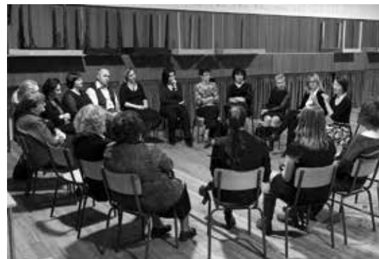
Tahák (pro učitele)

Chcete být v obraze a dozvědět se o speciálních nabídkách pro školy mezi prvními? Napište si o zaslání newsletteru pro pedagogy.