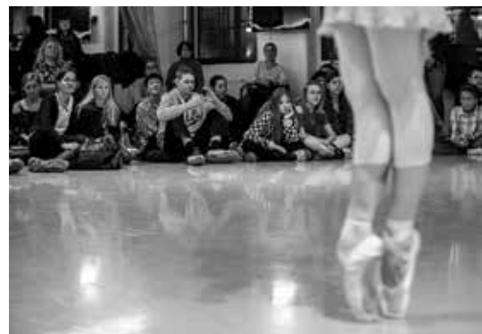
Je umění součástí vašeho života? Dancer do škol.

Co mne čeká? Jaké mám v životě šance? Je umění součástí mého života? Obstojí děti v konfrontaci s těmito otázkami? Proto se Balet ND rozhodl zapojit do projektu s názvem Dancer do škol. Ve spolupráci s kinem Lucerna a producentem a držitelem práv k filmu Dancer v ČR a SR MILOSH Ltd. nabízíme školním třídám možnost zhlédnout úspěšný dokumentární film Dancer o ukrajinském tanečnickovi Sergeji Poluninovi (v kině Lucerna). Následovat bude netradiční interaktivní workshop v prostorách Baletu ND.