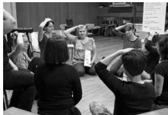
Workshop Být slyšet!