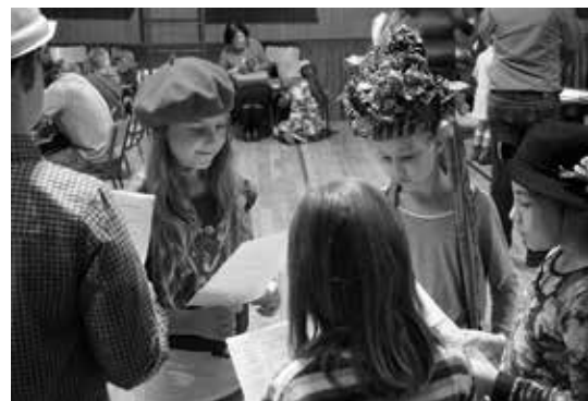
Tvůrčí dílna Divadlo? Divadlo!

V této tvůrčí dílně nahlédneme hravou a zážitkovou formou do divadelního provozu. Nejprve vás čeká prohlídková hra po Stavovském divadle, na zkušebně se pak dozvíte o divadelních profesích, které jsou divákovi oku leckdy skryté a sami si ledasco vyzkoušíte. Jaký pocit asi zažívá herec před diváky? Na co všechno musí myslet režisér? Kdo je to scénograf? A za jak dlouho stihnete bezchybně provést přestavbu scény? Tvůrčí program pro školy a zvědavé diváky ve věku 8 až 13 let. Dílny objednávejte na: tvucidilny@narodni-divadlo.cz