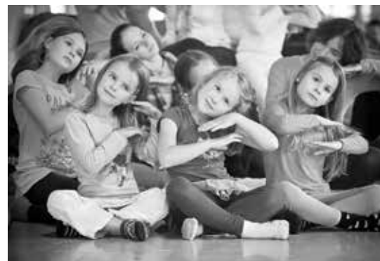
... budeš spát.