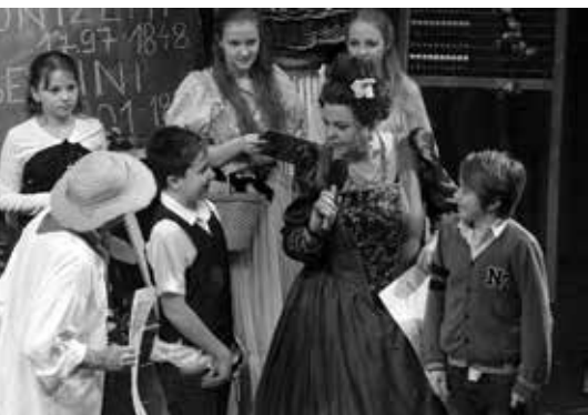
Opera nás baví

Cyklus je připraven podle stejnojmenné knihy a televizního seriálu pro rodiny s dětmi. Interaktivním a zábavným způsobem představuje v každém díle jednu výraznou skladatelskou osobnost a také dobu, ve které žila, či kdo ji inspiroval ke komponování.