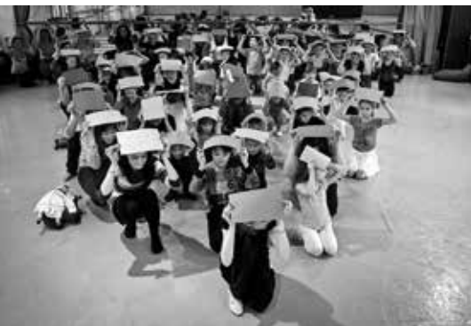
Vánoční strom na dílně Vivat Čajkovskij

Víte, co se stalo v roce 1888, jak souvisí cukrovinky s baletem, jestli je Odetta bílá, nebo černá, zda v Labutím jezeře vystupuje Vodník a co je to divertissement či tanec národů? Zažijete rekonstrukci světové premiéry baletu Labutí jezero , povíme vám, jak to bylo s návštěvou Čajkovského v Praze a proč jsou tři Čajkovského balety považovány za pilíře tohoto oboru.