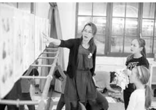
Jak vypadají originální kostýmní návrhy? Baletní dílna Tutu je balerína.

Více na: http://www.narodni-divadlo.cz/cs/balet/nas-bavi