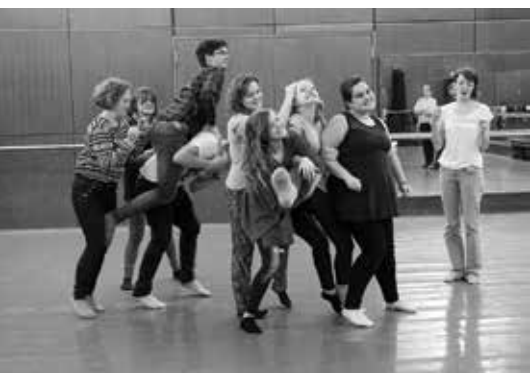
Tvůrčí dílna před představením Sen čarovné noci

Manon Lescaut Sen čarovné noci Mlynářova opička Jsme v pohodě Krvavá svatba Maryša Faust