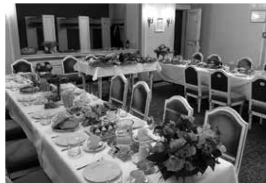
Snídaně v divadle

Napadlo vás někdy, jaké je to posnídat v historické budově Národního a Stavovského divadla v době, kdy se divadlo teprve probouzí? V tomto případě se může váš sen stát skutečností. Připravili jsme pro vás nový zážitkový formát setkání s divadlem. Snídaně bude vždy zaměřená na určité téma, které se váže k divadlu, divadelním epochám, profesím a osobnostem. Společný čas strávíme v rozhovoru s přizvanými hosty, zapojíte se do předčítání dobových textů, které dokreslí atmosféru. A po snídani se projdeme ztichlým divadlem. Přehled aktuálních témat a termínů naleznete na stránkách Národního divadla v sekci ND+.