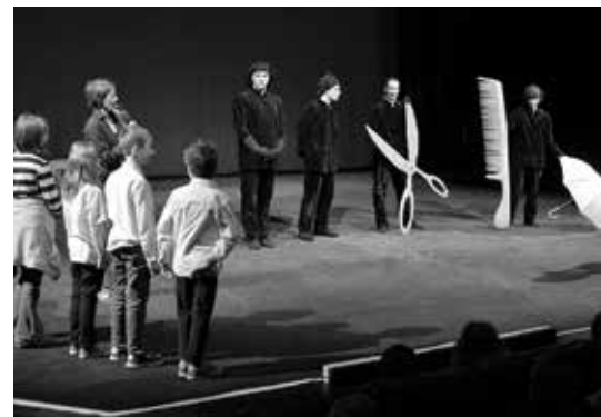
Seznamte se, Laterna