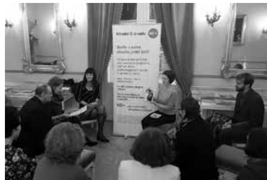
O hodinu dřív

Hodinu před začátkem představení jsou zváni všichni diváci, kteří se chtějí dozvědět o dané inscenaci, zkoušení, tvůrcích, autorovi a jeho divadelní hře, či to, na co není během dramaturgických úvodů dostatek času. Prostor tak dostanou i obrazové materiály, ukázky překladů nebo vzácnosti z archivu ND, setkáte se s dramaturgem, popřípadě jeho hosty.