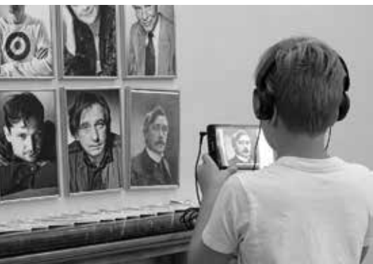
Videowalk Play Maeterlinck

Koná se pouze před představením Modrý pták .