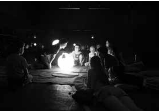
Tvůrčí dílna před představením Malý princ