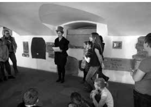
Tvůrčí dílna Národní hoří!