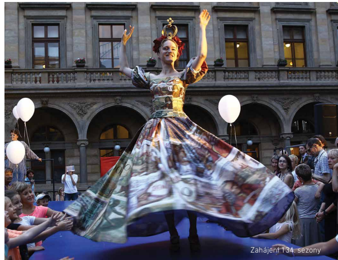
Zahájení 134. sezony

Soubor Činohry v létě nehraje, ale již nyní si zapište zahájení 135. sezony na náměstí Václava Havla – 1. 9. v 16.00 – a hlavně přijďte! Těšíme se na vás!