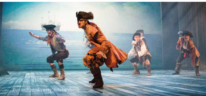
Podivuhodné cesty Julesse Verna